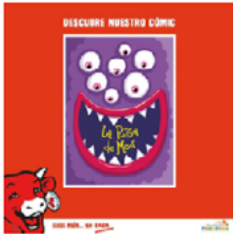
Primer cómic colaborativo con los niños hospitalizados y La Vaca que Ríe