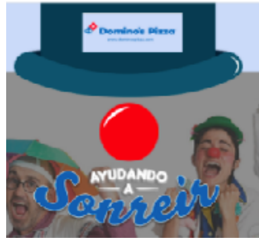
Domino's Pizza: ocho años colaborando por la evasión y sonrisas de los niños hospitalizados