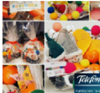
Fundación Telefónica reparte nuestras "Cestas de la felicidad" a ritmo de cuentacuentos