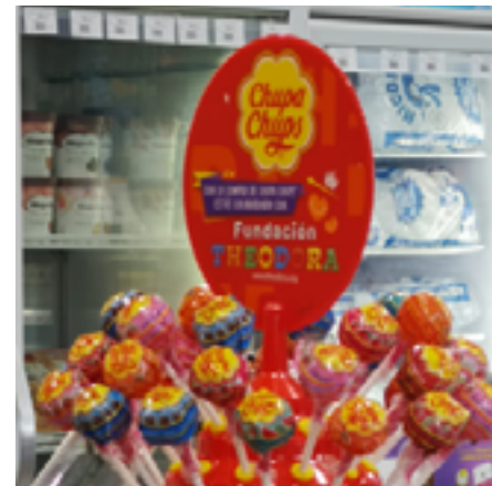
Chupa-Chups sigue endulzando la estancia en el hospital de miles de niños