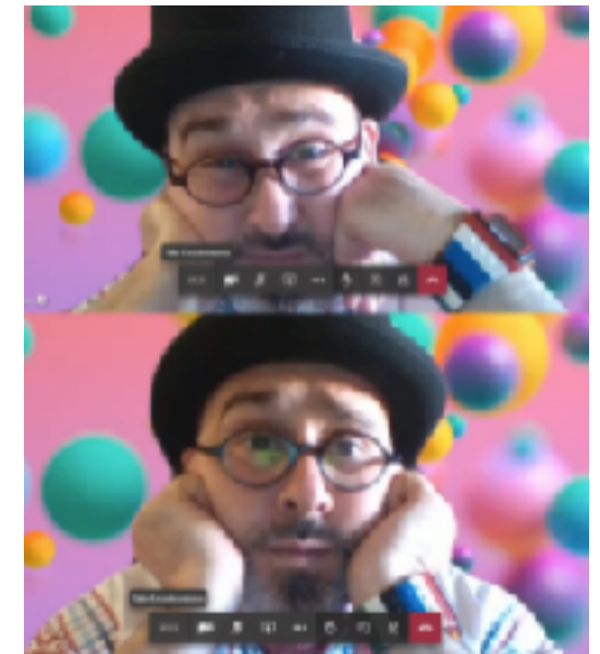
Cuentacuentos y regalitos solidarios para los hijos de los empleados de Procter&Gamble