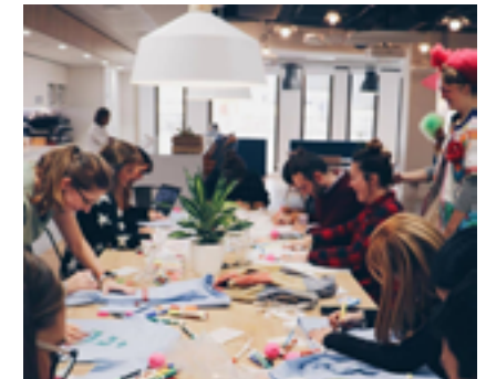
RB Spain realizó en equipo antes del COVID-19 los "Pijamas de la ilusión"