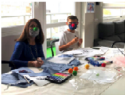
Empleados de CEPSA y sus familias participan en el taller online "Pijamas de la ilusión"